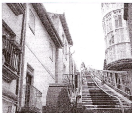
El PP quiere que se doten de más medios a los bomberos mirandeses.

Por ello ayer entregaron en el Regato municipal una propuesta de mejora del protocolo que incorpora, entre otros aspectos, la mejora del equipamiento que poseen los bomberos así como la adopción de determinadas medidas que ayudan a impedir que una vez apagado un fuego pueda reproductirse horas después y sin que allí exista un resaca o un control periódico de la situación.